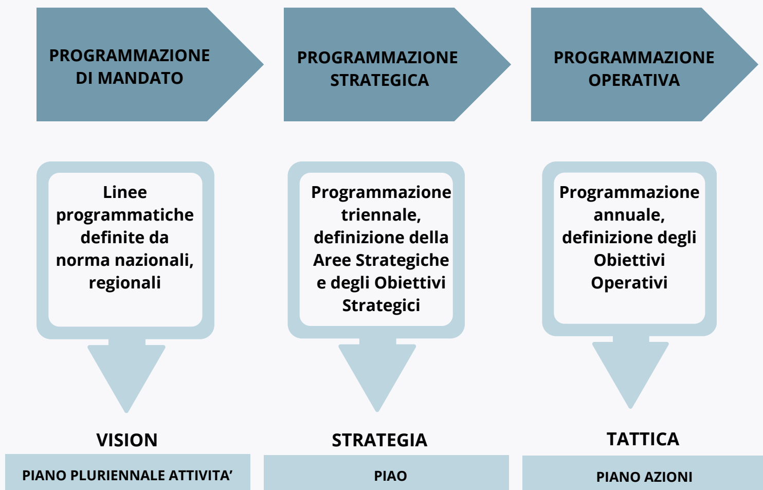
Figura della logica a cascata della programmazione

Un punto di forza del presente sistema è il collegamento diretto tra i vari livelli di programmazione, in cui la programmazione di mandato guida quella strategica, che viene attuata attraverso la programmazione operativa.